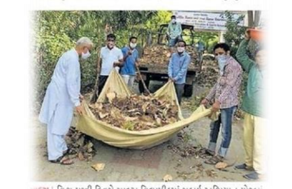
પરચમ્પુ વિશ્વ પૃથ્વી દિવસે સાદરા વિદ્યાપીઠમાં સહાઈ અભિયાન યોજાયું